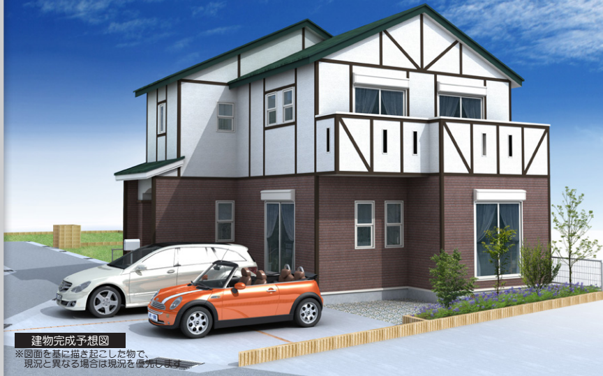
建物完成予想図 ※図面を基に描き起こした物で、 現況と異なる場合は現況を優先します。