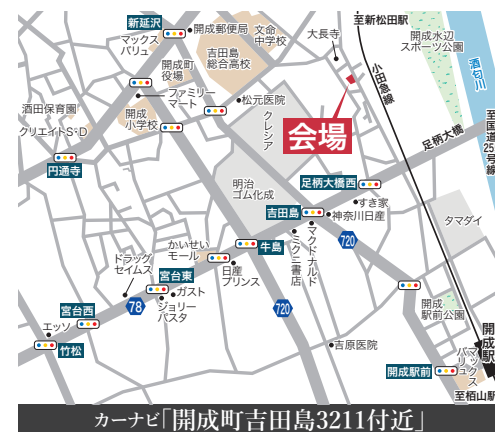
カーナビ「開成町吉田島3211付近」