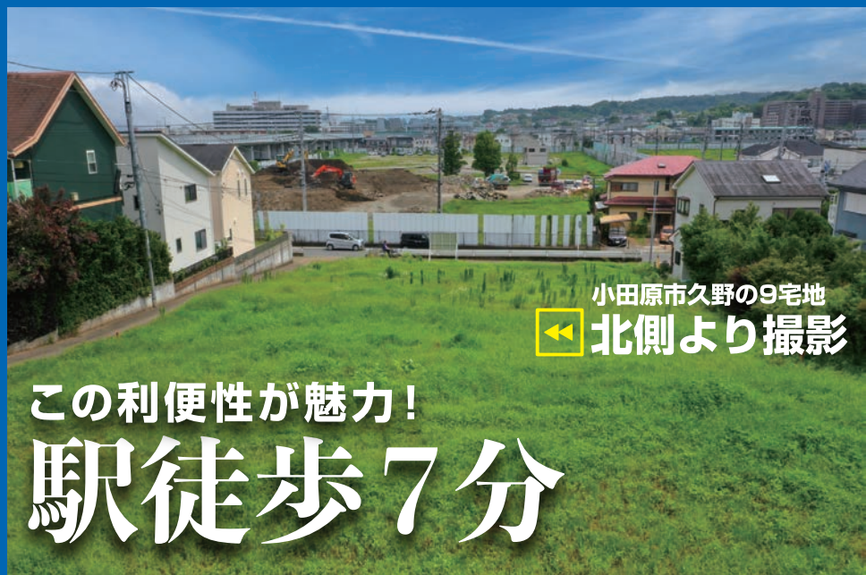
小田原市久野の9宅地 北側より撮影