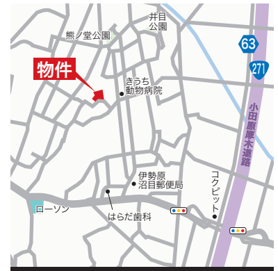
カーナビ「伊勢原市沼目3丁目18付近」

■交通 / 小田急線伊勢原駅徒歩21分またはバス5分停歩5分 ■土地 / 130.00㎡(39.32坪)~135.08㎡(40.86坪) ■建物 / 97.91㎡(39.55坪)~116.26㎡(35.09坪) ■構造 / 木造2階建 ■用途 / 第1種低層住居専用地域 ■間取 / 5:4LDK+WIC+SIC+パントリー 6:3LDK+WIC+SIC+スノック+パントリー 7:3LDK+WIC+SIC+パントリー+サービスルーム 8:3LDK+WIC+SIC+パントリー ■完成予定 / R5年9月末 ■確認番号 / 第2023SBC-確00626H号他 ■設備 / 私営水道・私営下水・東京電力・都市ガス ■販売価格(税込) / 3,280万円~3,900万円 ■所在 / 伊勢原市沼目3丁目 *道路幅員約4.5m、全4棟販売、他ゴミ置き場持分4.49㎡×1/9有、他開発道路持分387.09㎡×1/13有、他給排水用地持分26.86㎡×1/13有 (売主)