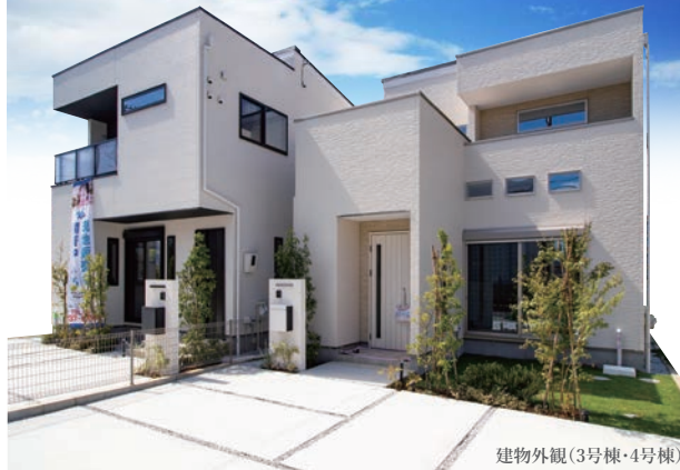
建物外観(3号棟・4号棟)