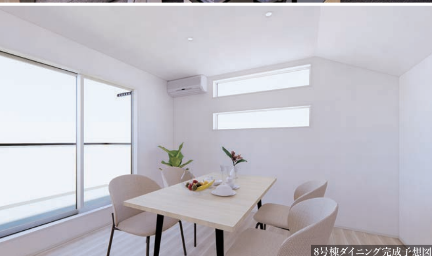
8号棟ダイニング完成予想図