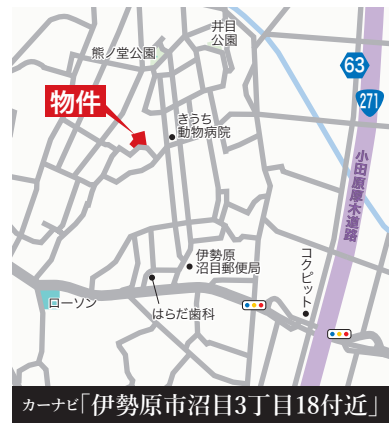
カーナビ「伊勢原市沼目3丁目18付近」

■交通 / 小田急線伊勢原駅徒歩21分またはバス5分停歩5分 ■土地 / 130.00㎡(39.32坪)~135.08㎡(40.86坪) ■建物 / 97.91㎡(39.55坪)~116.26㎡(35.09坪) ■構造 / 木造2階建 ■用途 / 第1種低層住居専用地域 ■間取 / 5:4LDK+WIC+SIC+パントリー 6:3LDK+WIC+SIC+ヌック+パントリー 7:3LDK+WIC+SIC+パントリー+サービスルーム 8:3LDK+WIC+SIC+パントリー ■完成予定 / R5年9月末 ■確認番号 / 第2023SBC-確00626H号他 ■設備 / 私営水道・私営下水・東京電力・都市ガス ■販売価格(税込) / 3,280万円~3,900万円 ■所在 / 伊勢原市沼目3丁目 *道路幅員約4.5m、全4棟販売、他ゴミ置き場持分4.49㎡×1/9有、他開発道路持分387.09㎡×1/13有、他給排水用地持分26.86㎡×1/13有 (売主)