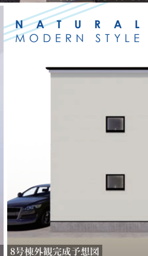
8号棟外観完成予想図