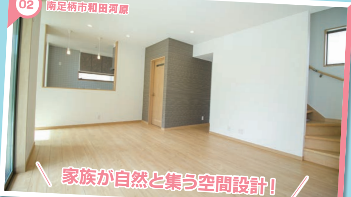
家族が自然と集う空間設計!