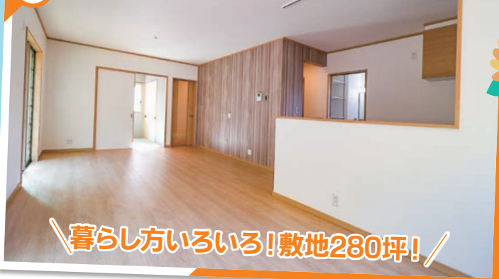
暮らし方いろいろ!敷地280坪!