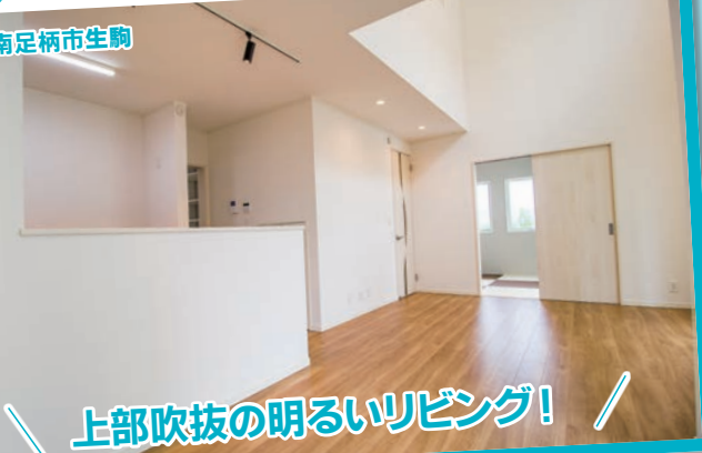
上部吹抜の明るいリビング!