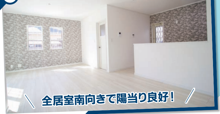
全居室南向きで陽当たり良好!