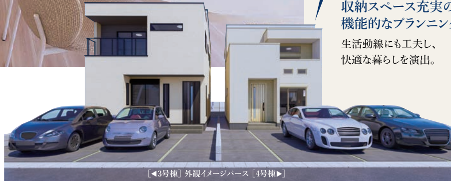
◀3号棟▶ 外観イメージパース ▶4号棟▶