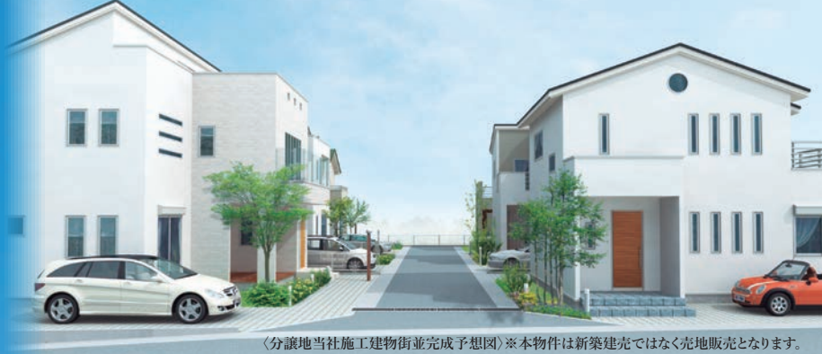
（分譲地当社施工建物街並完成予想図）※本物件は新築建売ではなく売地販売となります。