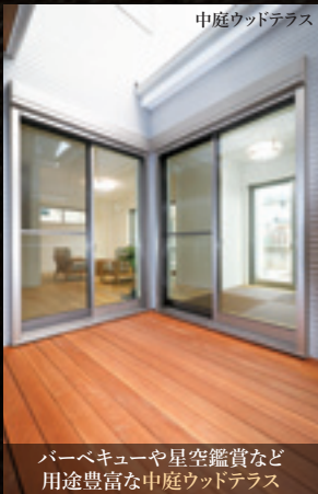
中庭ウッドテラス