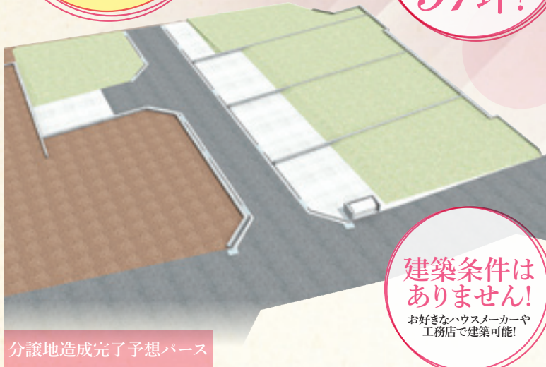
分譲地造成完了予想パース